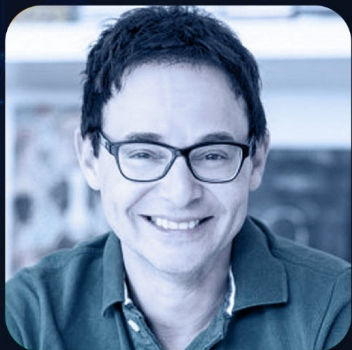
Jairo Bouer Médico psiquiatra e educador

Doutor Jairo Bouer, médico psiquiatra especialista em sexualidade, educação sexual e saúde em geral. Participante do Encontro com Fátima Bernades.